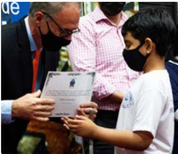
Prima di copertina: Visite scolastiche a Gengma, Cina

Una potente tecnica SSEHV che aiuta i bambini a imparare a coltivare la quiete interiore è Stare Seduti in Silenzio . I benefici sono molteplici, tra cui il miglioramento della concentrazione e della memoria e la riduzione dell'ansia. Invitando gli studenti a sedersi comodamente e a chiudere gli occhi, concentrandosi sul loro respiro, essi sperimentano e apprezzano il calmo e pacifico ambiente interiore. In questo ambiente intimo e tranquillo, si fermano e imparano a osservarsi e a fare scelte consapevoli. Quando diventano consapevoli che la Bontà e la Bellezza dei Valori Umani risiedono in loro, la consapevolezza si risveglia e la coscienza si illumina.