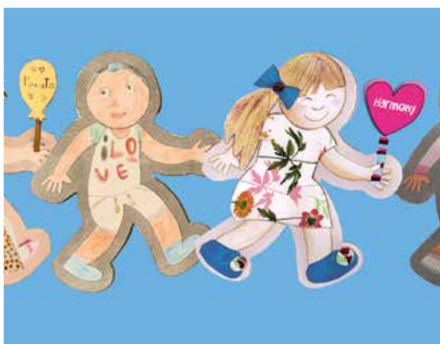
AMIGOS DE LA PAZ UN PROYECTO PARA TODOS

Este programa sin precedentes para la escuela pública maestros diseñados para elevar la educación cívica con enfoque de valor , y aprobado por el Ministerio Italiano de La Educación, es continua. Su concepto general está vinculado a el área de la educación que se ocupa del sostenible desarrollo y está siendo llevado a cabo por el equipo Italiano del Instituto de Educación Sathya Sai del Sur de Europa (ISSE SE). El primer módulo del Programa de Formación “Educación en Valores Humanos - Un Camino para la Vida”, destacada por el acróstico “P.A.C.E.: Pensieri en Armonía, Comportamiento en Equilibrio” ( PAZ: Pensamientos en Armonía, Comportamiento en Equilibrio ), se llevó a cabo en línea desde Octubre 2021 hasta Junio 2022. El programa continuará a lo largo del 2023 con módulos 2 y 3.