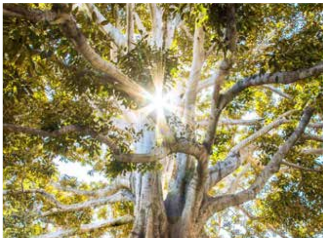
EDUCACIÓN EN VALORES HUMANOS “UN CAMINO HACIA LA PAZ” (Italia, 2021-22-23)