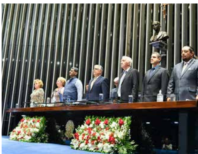
RECONOCIMIENTO al ISSE de BRASIL (Brasil, 26 de agosto, 2022)