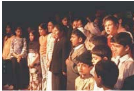
Estados Unidos de América