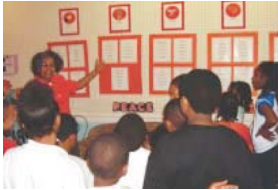
Estados Unidos de América