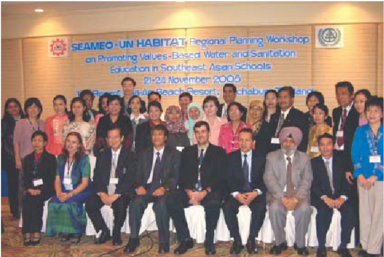
Οι εκπαιδευτικοί Σάττα Σάι βοηθούν τους Υπουργούς Παιδείας της Νοτιοανατολικής Ασίας (SEAMEO) και τους αρμόδιους του προγράμματος ανθρώπινων οικισμών (UN-HABITAT) των Ηνωμένων Εθνών να εισαγάγουν στις χώρες τους την Εκπαίδευση στις Ανθρώπινες Αξίες σε σχέση με την υδάτινη διαχείριση.

Η μεγάλη εμπειρία που αποκτήθηκε από την Εκπαίδευση Σάττα Σάι τις τελευταίες τέσσερις δεκαετίες στην εισαγωγή των Ανθρωπίνων Αξιών σε όλα τα μέρη του κόσμου, τράβηξε την προσοχή πολλών εκπαιδευτικών φορέων και διεθνών οργανισμών, όπως τα Ηνωμένα Έθνη. Η διεθνής συνεργασία και η ανταλλαγή εμπειριών έπαιξαν σημαντικό ρόλο στην κατανόηση του Εκπαιδευτικού Συστήματος Σάττα Σάι, ώστε πολλοί να απολαύσουν τα ευεργετικά αποτελέσματα των προγραμμάτων του.