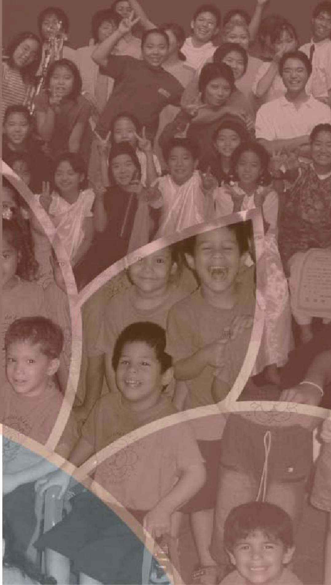
Πάνω : Ιαπωνία Κάτω : Παραγουάνη