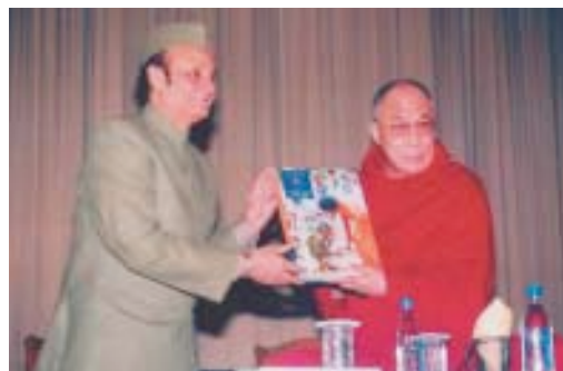
El Dr. Karan Singh con S.E. el Dalai Lama en el Centro Internacional Sri Sathya Sai en Nueva Delhi.

El Centro administra una Escuela Sathya Sai para niños de bajos recursos y niños que abandonaron la escuela, proporcionando actividades de ESSVH a un grupo de edades variadas. El Centro proporciona un programa de alcance social a estudiantes de la Universidad de Delhi. El programa incluye debates y competencias inter-colegiales de diseño de afiches, redacción de lemas, confección de collage, canto y lectura sobre temas relacionados con la ESSVH. Por ejemplo, se llevó a cabo un debate en noviembre de 2005 sobre el tema "Ninguna civilización puede prosperar sin valores humanos". El Centro ha organizado a interva-