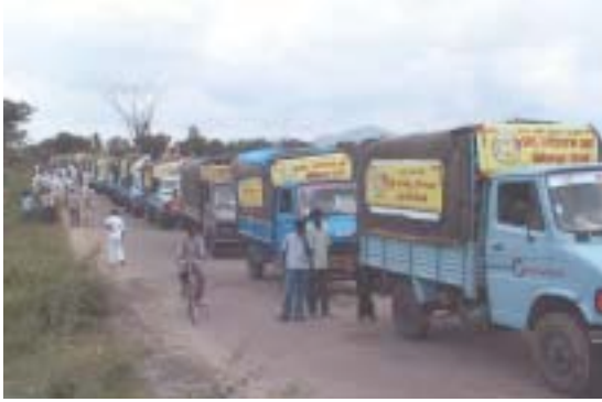
Grama Seva (servicio a los pobres en zonas rurales) por parte de los estudiantes y profesores de la Universidad