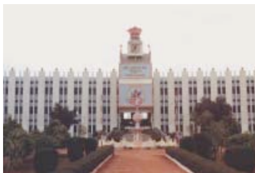
Campus de Brindavan