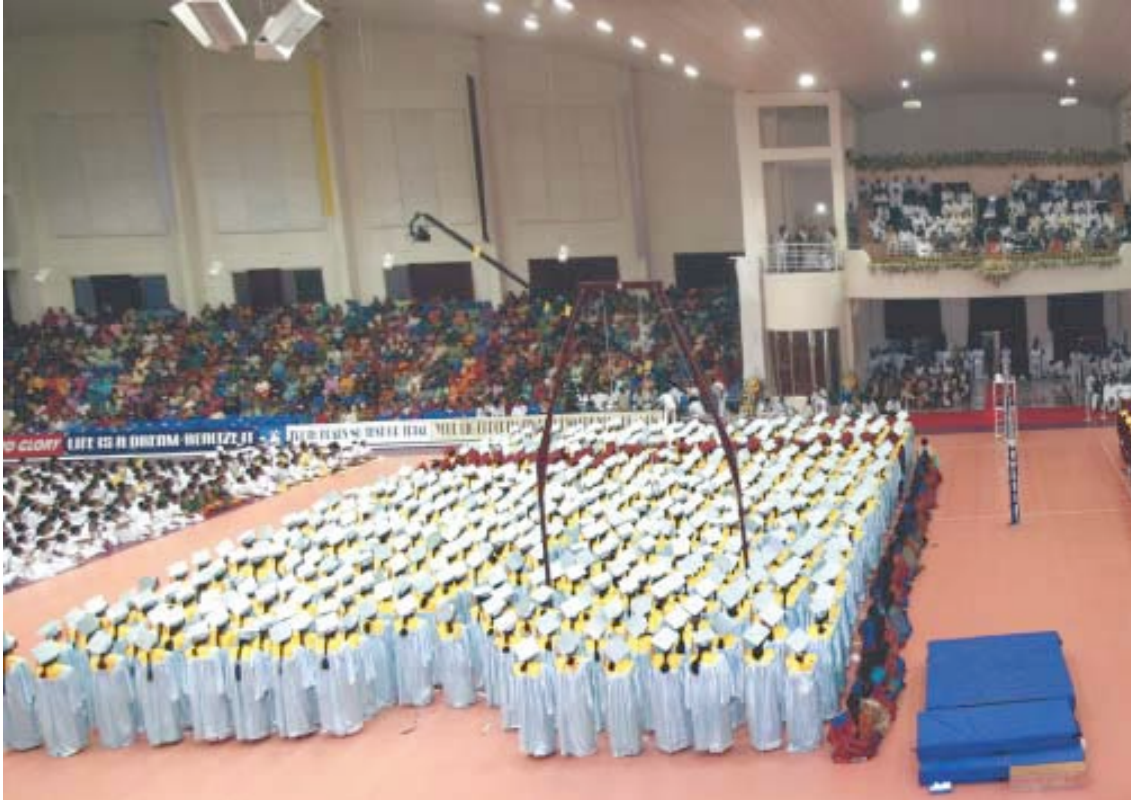
Una vista panorámica de la Ceremonia de la vigésimo quinta Convocación del Instituto llevada a cabo en el Centro Internacional de Deportes Sri Sathya Sai, el 22 de noviembre de 2006

La confianza en sí mismos es el Cimiento, el sacrificio de sí mismos es la Pared, la satisfacción consigo mismos es el techo y la realización del Ser es la vida. Ésta es la Mansión de la vida a la que uno debe aspirar.