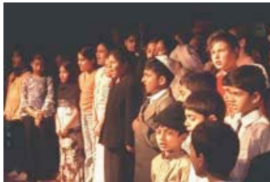
Estados Unidos de América