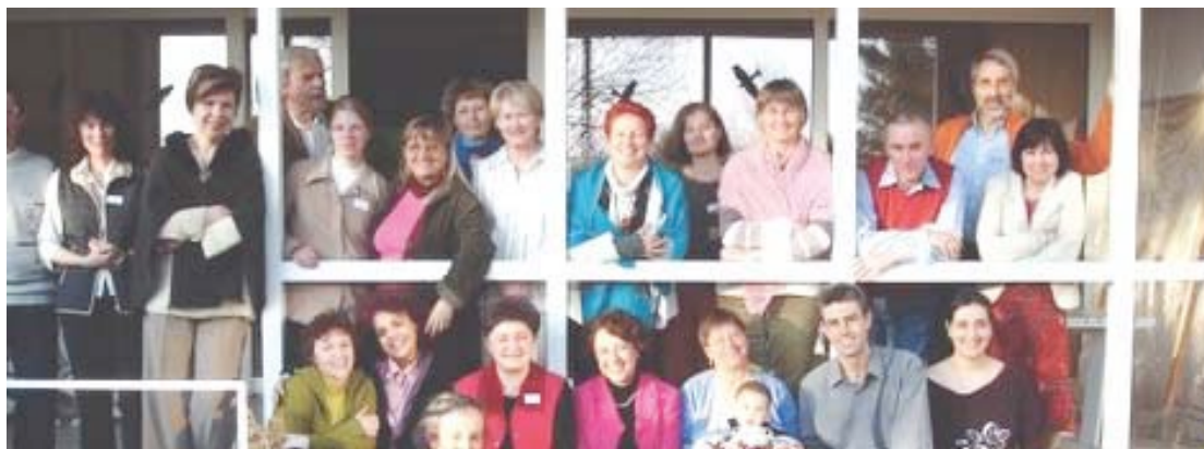
Instituto ESSE (Dinamarca)