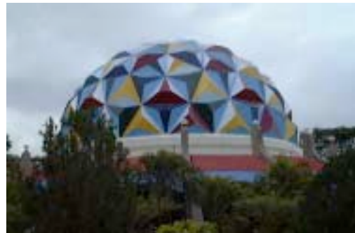
Planetario, Universidad Sri Sathya Sai