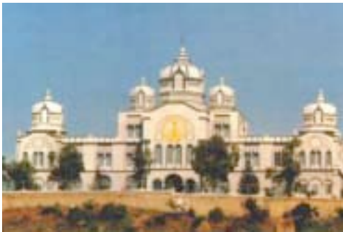
Edificio Administrativo, Universidad Sri Sathya Sai

Los Colleges Sathya Sai afiliados a la Universidad, así como también otros Colleges Sathya Sai en India, sirven como modelos de excelencia para la educación terciaria.