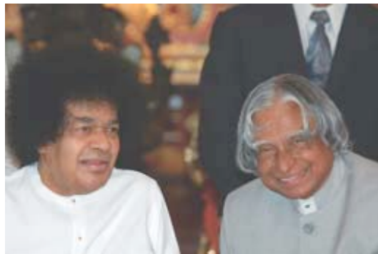
Sri Sathya Sai Baba con el Presidente de India después de la inauguración del Centro de Deportes