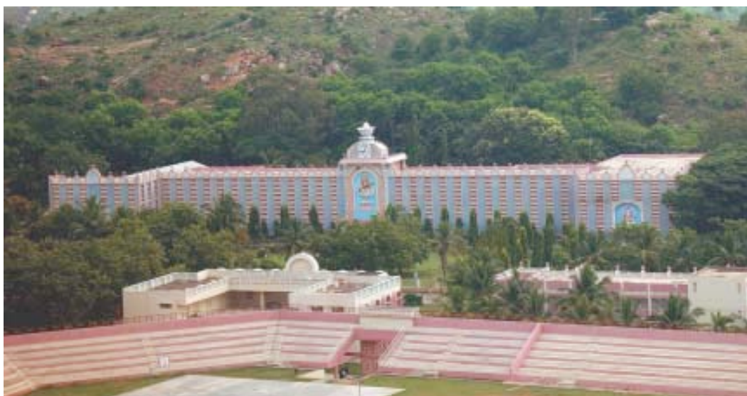
Campus de Prasanthi Nilayam con el Estadio Hill View en primer plano