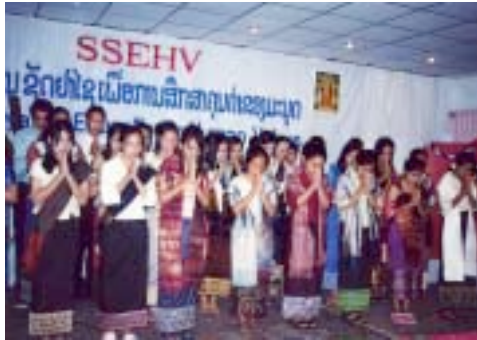
RDP de Laos