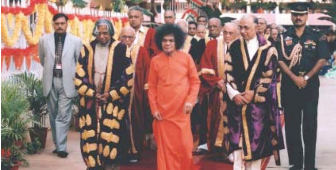
Sri Sathya Sai Baba el día de la Convocación con el Invitado de Honor, el Presidente de India

“Esta Universidad no estará impartiendo en Botánica el mero conocimiento de los árboles de la naturaleza; difundirá el conocimiento del árbol del verdadero vivir.