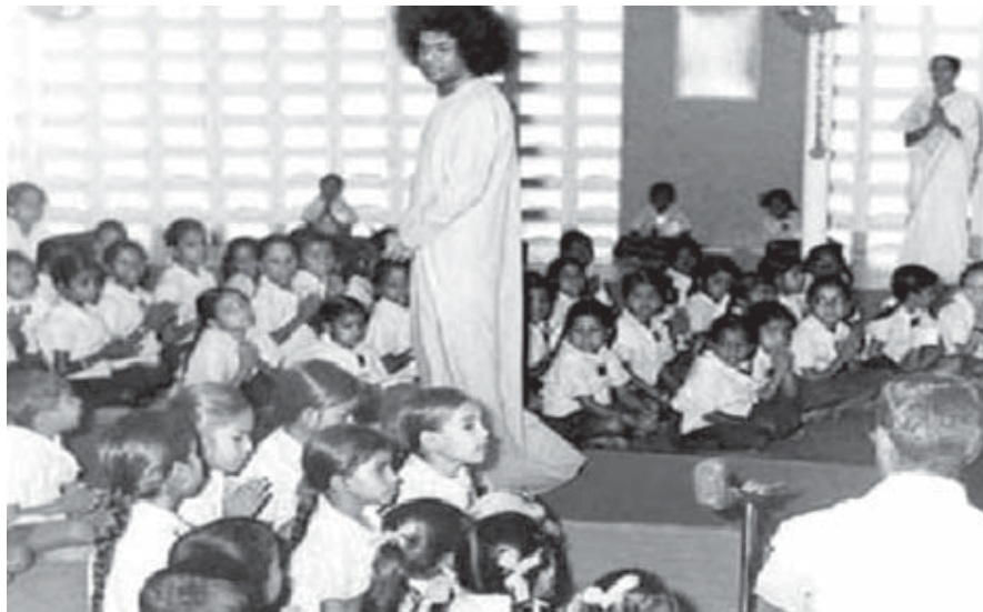
Sri Sathya Sai Baba con niños de Bal Vikas