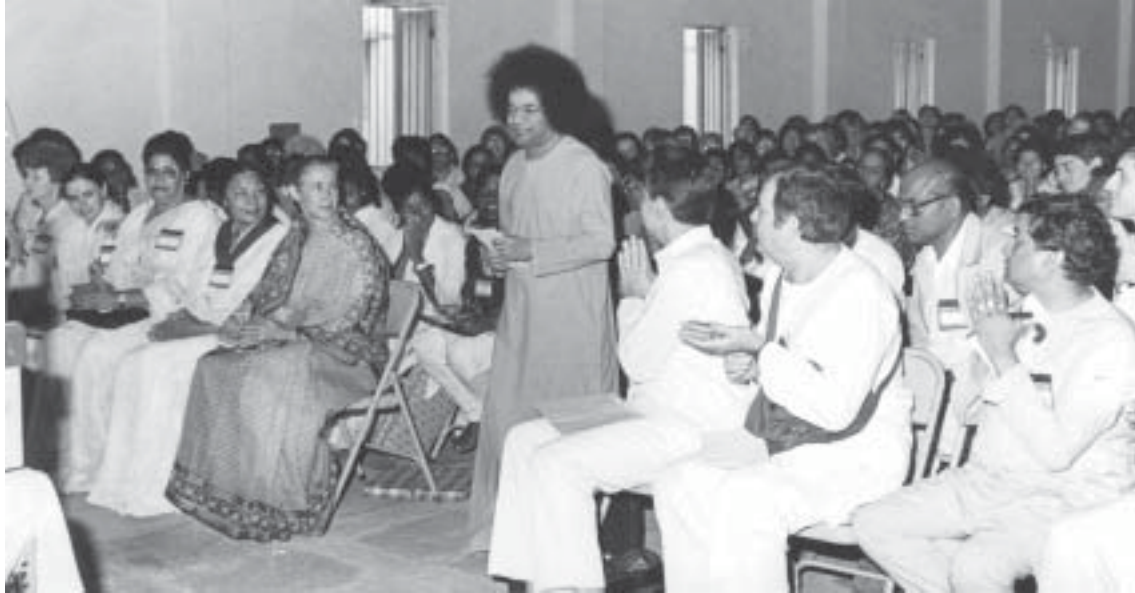
Sri Sathya Sai Baba en una Conferencia realizada para celebrar el 15º aniversario del Programa de Bal Vikas, Prashanti Nilayam, 1983.

Los principios rectores del término Educare , como lo utiliza Sri Sathya Sai Baba, son: