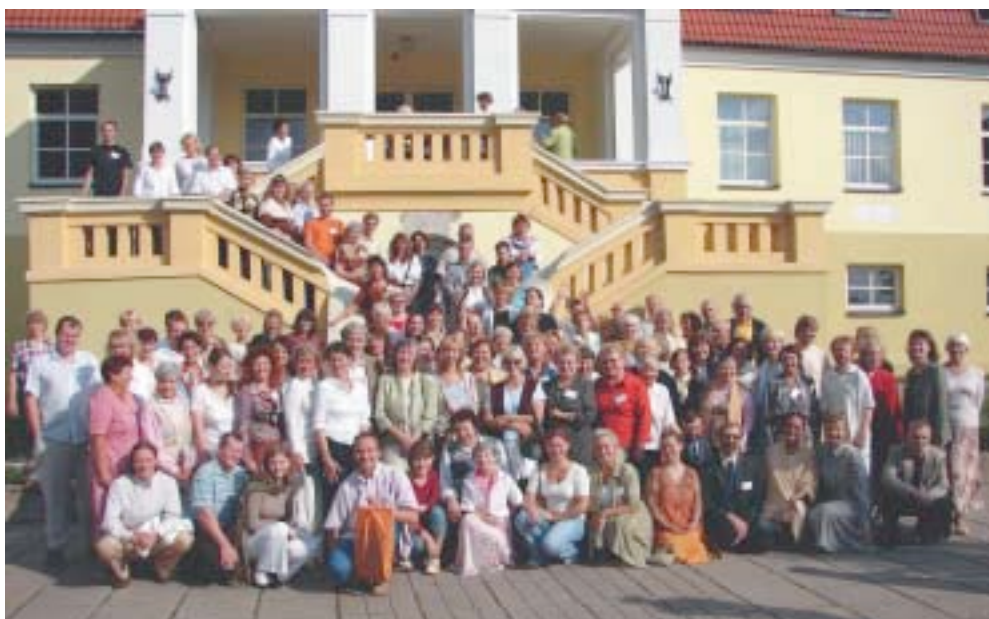
ESSE (Dinamarca) durante un seminario de ESSVH en Lituania

Después de la Conferencia, el IESS-Australia proporcionó entrenamiento adicional a facilitadores en varios países. Se realizaron talleres, seminarios y conferencias en Nueva Zelanda (1999), Papua Nueva Guinea (2001), Fiji (2001), Japón (2000, 2004), Hong Kong (2000, 2004), Taiwán (2000, 2004), Malasia (2004), Indonesia (2004), Sri Lanka (2000, 2004) y Singapur (2004, 2006).