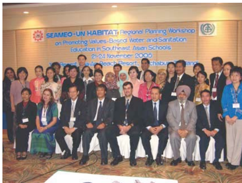
Educadores Sathya Sai ayudan a SEAMEO y a UN-HABITAT a implementar la Educación En el uso del Agua basada en Valores Humanos en los Países del Sudeste Asiático

El compartir esta experiencia con otros organismos internacionales, que invierten en el fomento de la educación en países alrededor del mundo, será de importancia estratégica. Un buen comienzo en esta dirección ya ha tenido lugar a través de nuevas asociaciones con el Asian Development Bank (ADB) y la South East Asian Ministers of Education Organization (Organización de Ministros de Educación del Sudeste de Asia), SEAMEO.