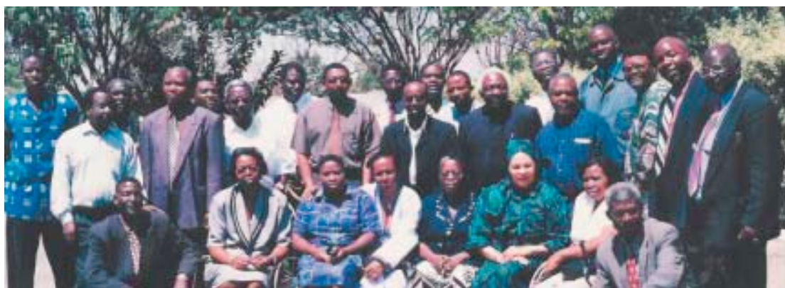
IESS-Zambia proporcionando entrenamiento en ESSVH a educadores de países africanos.

La educación aborígen (indígena) sigue constituyendo un desafío. Aunque el gobierno ha proporcionado cada vez más recursos financieros y ha creado mejores facilidades educacionales, esto no ha mejorado los logros, que mantienen niveles pobres, ni ha evitado los altos porcentajes de deserción y el elevado fracaso educacional en esta comunidad. La siguiente es una descripción de la Escuela del Estado de Cherbourn, que es un modelo para la educación aborígen.