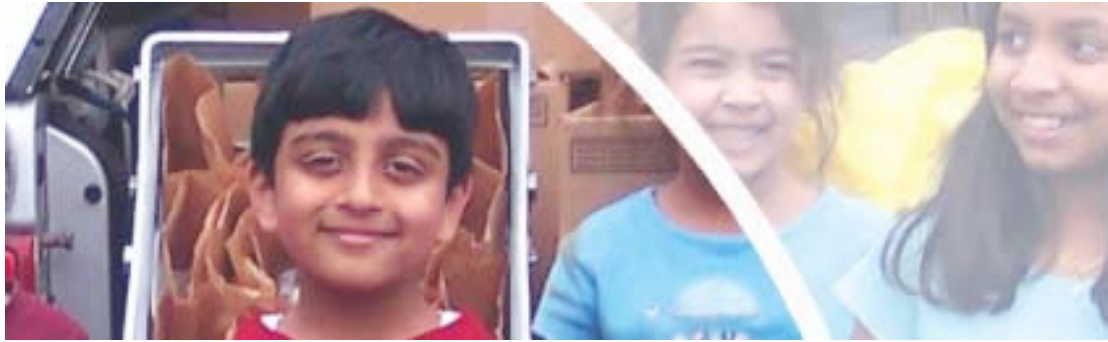
Estados Unidos de América