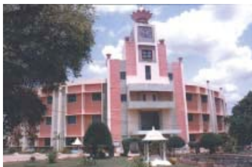
Campus de Anantapur

El alto nivel académico de la Universidad es asegurado por profesores dedicados que viven en el campus. A los estudiantes se les proporcionan las mejores oportunidades y el mejor ambiente dentro y fuera de las clases para alcanzar la excelencia académica. Los programas de investigación de la Universidad son diseñados teniendo en cuenta su aplicabilidad a las necesidades sociales. La educación en la Universidad está enfocada en proporcionar un orden de razonamiento y exploración más elevado. La Universidad fue la primera en ofrecer en India un curso integrado de cinco años que conducía a un título de Maestría, exponiendo a los estudiantes a un pensamiento riguroso desde el primer año. Las reformas en los programas de estudio son frecuentes y ayudan a mantener los programas académicos lozanos y dinámicos. Las evaluaciones del aprendizaje de los estudiantes son conducidas periódicamente y también al final del semestre.