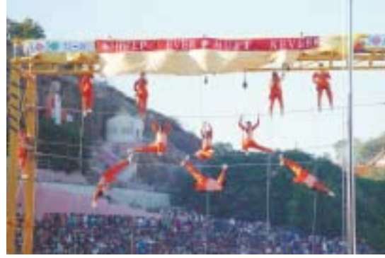
Las estudiantes mujeres de la Universidad hacen su exhibición en el Encuentro Deportivo

Si me preguntan cuál es mi propiedad, muchos esperan que la respuesta sea: ¡Ah! Todos estos edificios, toda esta vasta extensión de tierra. Sin embargo, mi respuesta es: Toda mi propiedad consiste en mis estudiantes. Me he ofrecido yo mismo a ellos.