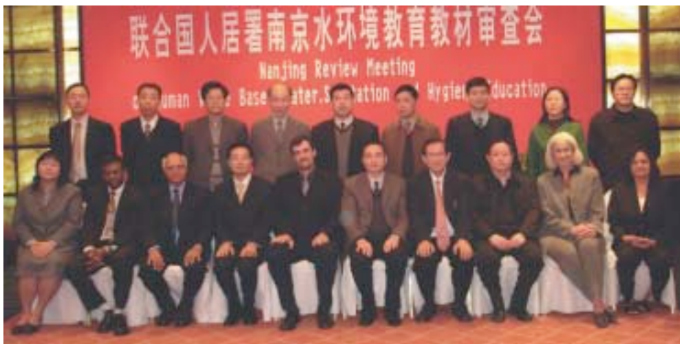
Educadores Sathya Sai en una reunión de ESSVH en Nanjing, China.

El IESS-Australia también ofreció entrenamiento en ESSVH a maestros de escuelas estatales en Taiwán en dos ocasiones separadas. Aproximadamente 80 maestros y padres asistieron en cada ocasión. El programa de entrenamiento de maestros en la pedagogía de valores humanos de Taiwán ahora está siendo utilizado por el IESS-Hong Kong y por los ex-alumnos del IESS-Australia que recibieron su Diploma en Educación en Valores Humanos.