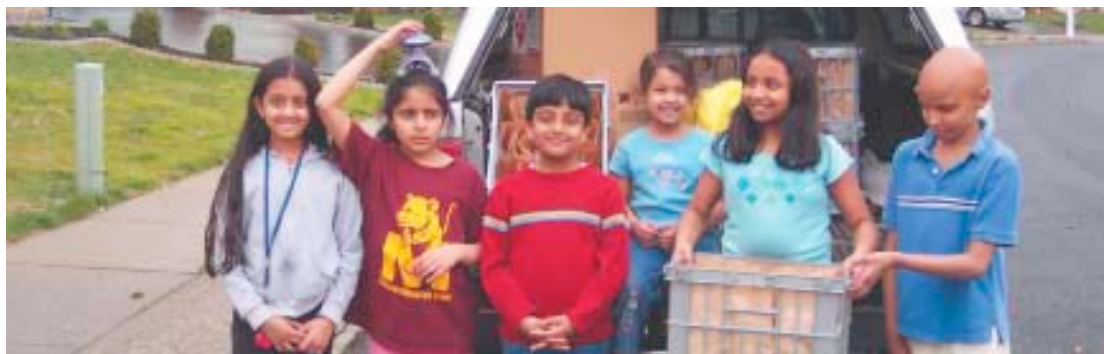
Estados Unidos de América