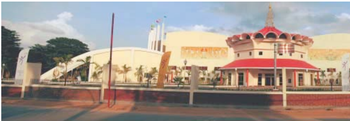
Centro Internacional de Deportes Sri Sathya Sai, Prasanthi Nilayam

Sin embargo, el rasgo más sobresaliente de esta Universidad, que la hace tan única es el proceso triangular, mutuamente fortalecedor, de aprendizaje y transformación que la Universidad ofrece a cada estudiante: las lecciones aprendidas en la proximidad inmediata y mediante la interacción directa con el venerado Rector; la integración de valores al conocimiento secular a través del currículum y la enseñanza en las clases; y la traducción de estas lecciones a las habilidades prácticas a través del diario vivir en el ambiente de la residencia para alumnos internos, el campo de deportes y el servicio social. Esto es explicado en detalle en las secciones siguientes.