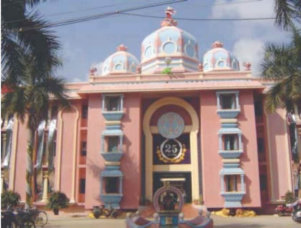
Campus de Prasanthi Nilayam

La educación física es muy alentada, y cada campus está bien equipado con campos de juegos, gimnasios y facilidades para el entrenamiento. El énfasis en todas estas actividades es desarrollar “una mente sana en un cuerpo sano”, inculcando un sentido de cooperación más que de competición. El campo de deportes sirve como un terreno para desarrollar valor, confianza y compañerismo. Esto es demostrado perfectamente en el Encuentro Deportivo anual cuando los muchachos y muchachas de la Universidad realizan las proezas aeróbicas más intrincadas en el aire o efectúan actos de osadía con motocicletas después de una práctica mínima, dado su programa diario extremadamente atareado. La clave de la confianza en sí mismos reside en su amor por el venerado Rector y su determinación de lograr hacerlo feliz. La vida en el campus también proporciona amplias oportunidades para nutrir los talentos de los estudiantes en música, danza, drama y oratoria.