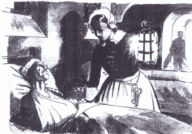
Florence Nightingale het die naam "Die vrou met die lamp"